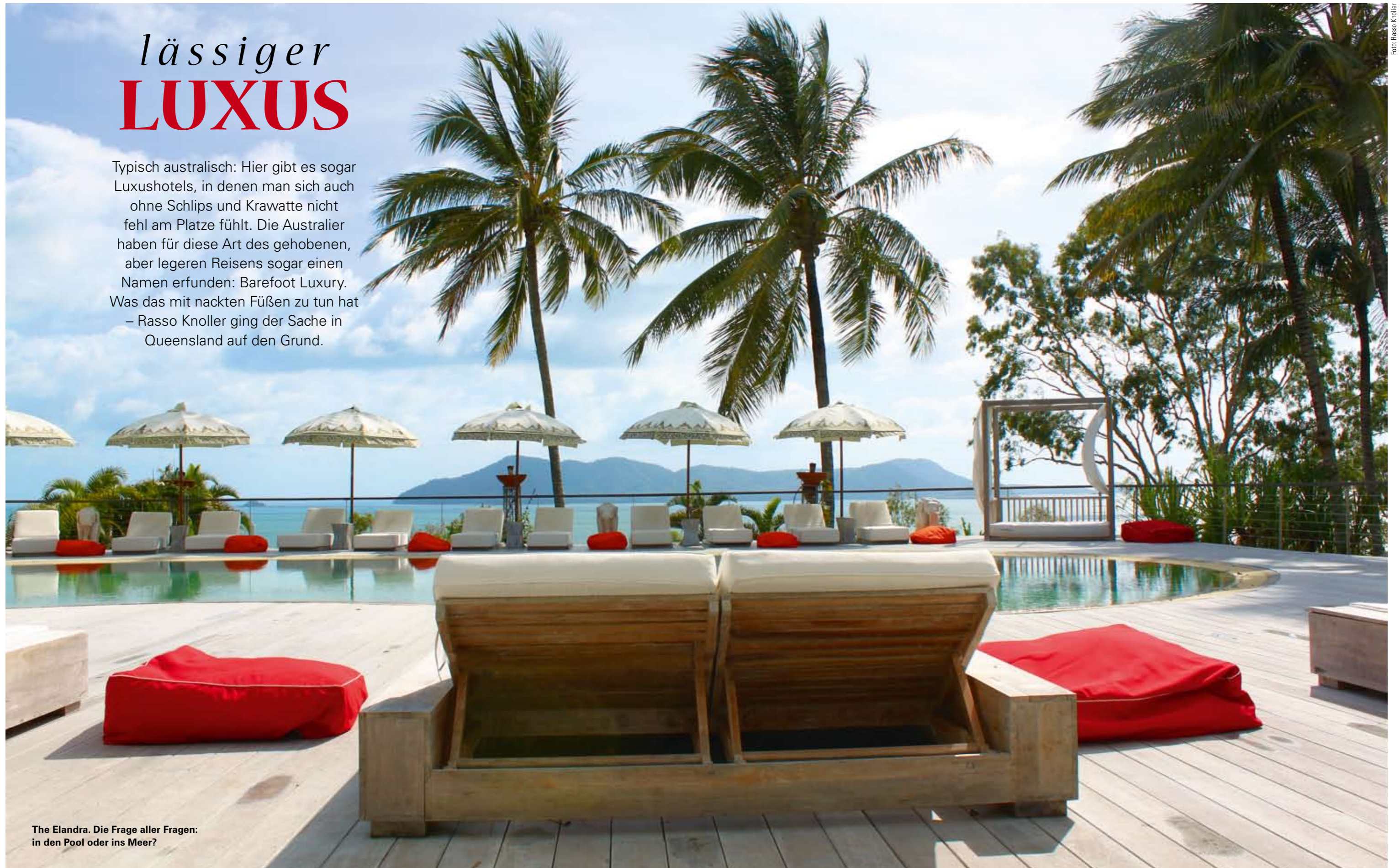
The Elandra. Die Frage aller Fragen: in den Pool oder ins Meer?

Typisch australisch: Hier gibt es sogar Luxushotels, in denen man sich auch ohne Schlips und Krawatte nicht fehl am Platze fühlt. Die Australier haben für diese Art des gehobenen, aber legeren Reisens sogar einen Namen erfunden: Barefoot Luxury. Was das mit nackten Füßen zu tun hat – Rasso Knoller ging der Sache in Queensland auf den Grund.