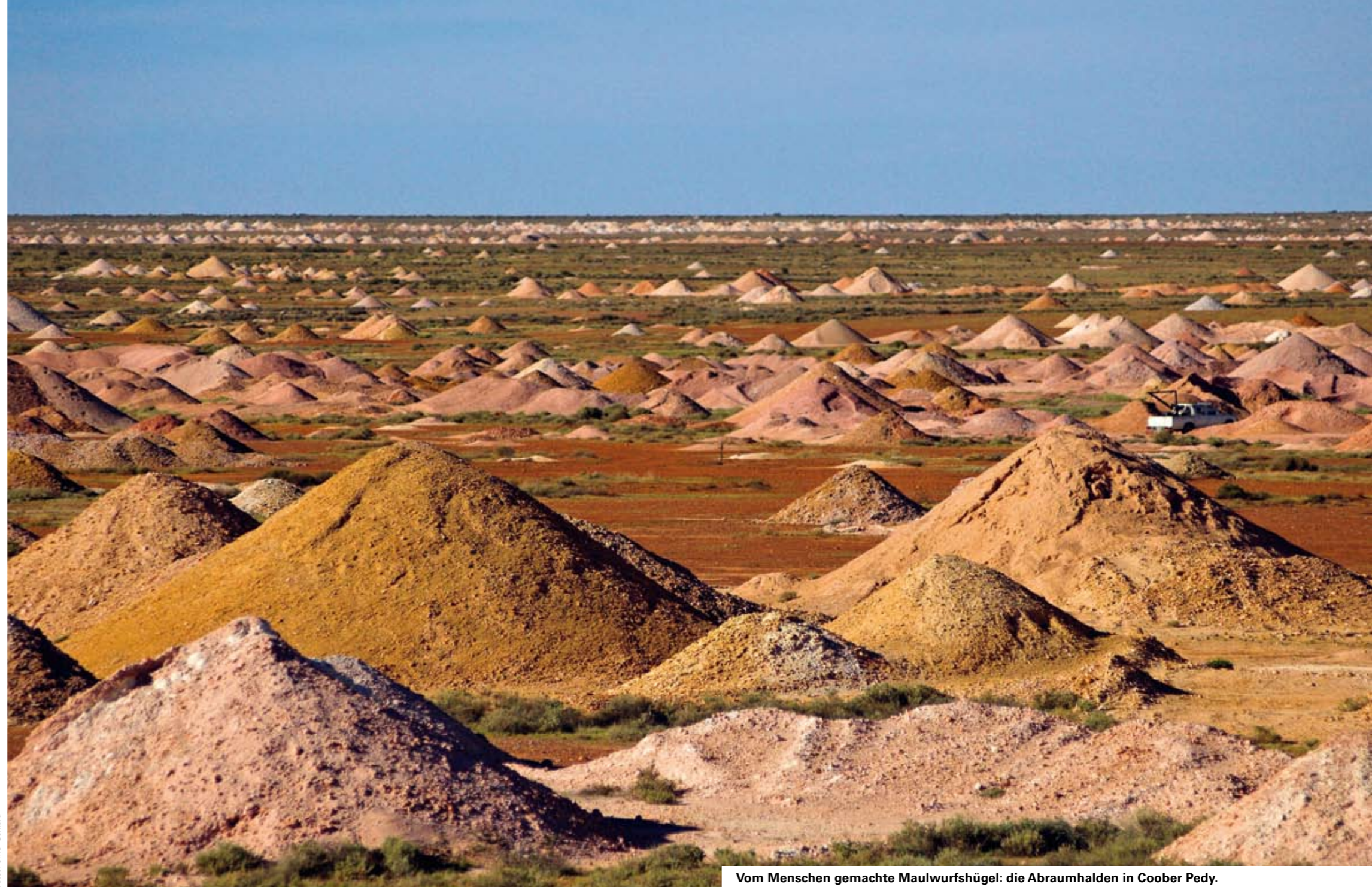
Vom Menschen gemachte Maulwurfshügel: die Abraumhalden in Coober Pedy.

Im südaustralischen Coober Pedy ist das Opalschürfen eine Lebenseinstellung. Selbst die, die mit den Steinen reich geworden sind, führen im sengenden Niemandsland oft noch ihr raues und entbehrungsreiches Leben – und graben immer weiter. Von Oliver Gerhard