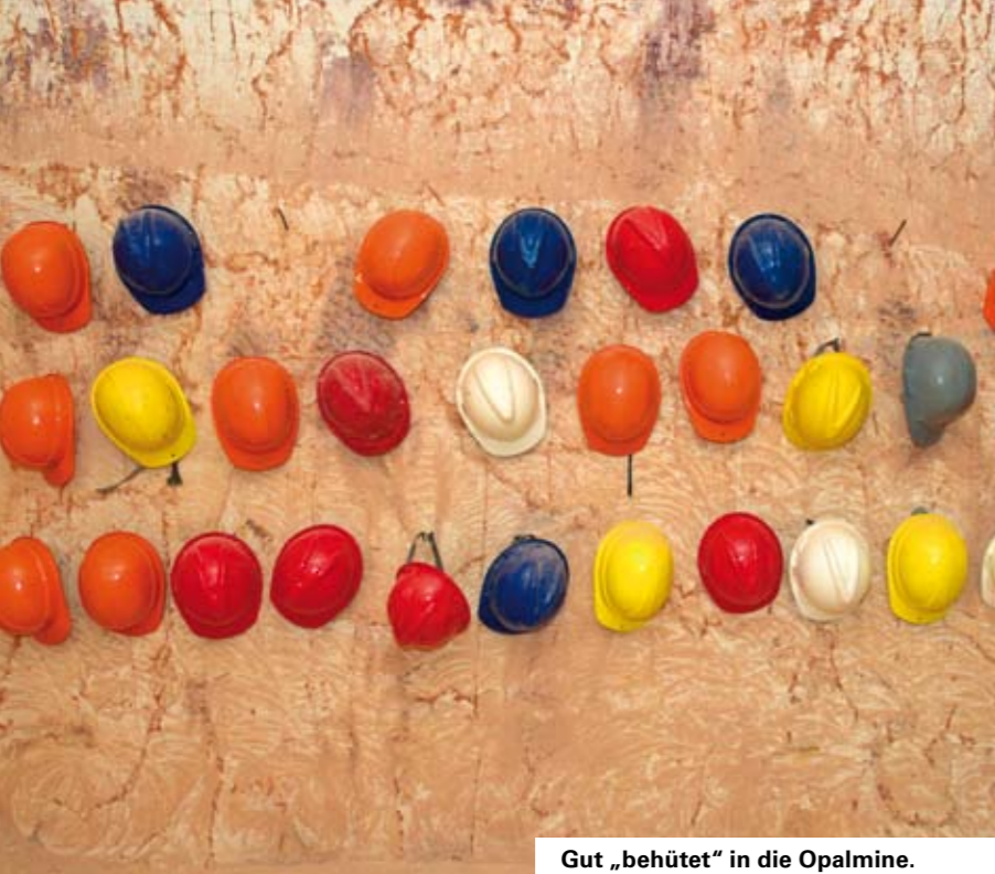
Gut „behütet“ in die Opalmine.